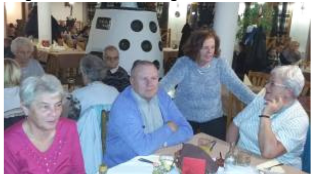
Torkos csütörtök Táton 2016

Ezúton is köszönöm a tagok aktivitását, lelkesedését hogy mindnyájan jól érezhettük magunkat, aktívan, tartalmasan tudtuk eltölteni szabadidőnket. Most úgy gondolom, hogy jól döntöttünk, nem lett volna szabad abbahagyni a klubot, mert ezekkel az élményekkel biztos, hogy szegényebbek lettünk volna. 2016. évprogramját is összeállítottuk, figyelembe véve a tagság ötleteit, mi volt jó, mit ismételjünk milyen új dolgokat szervezzünk meg.