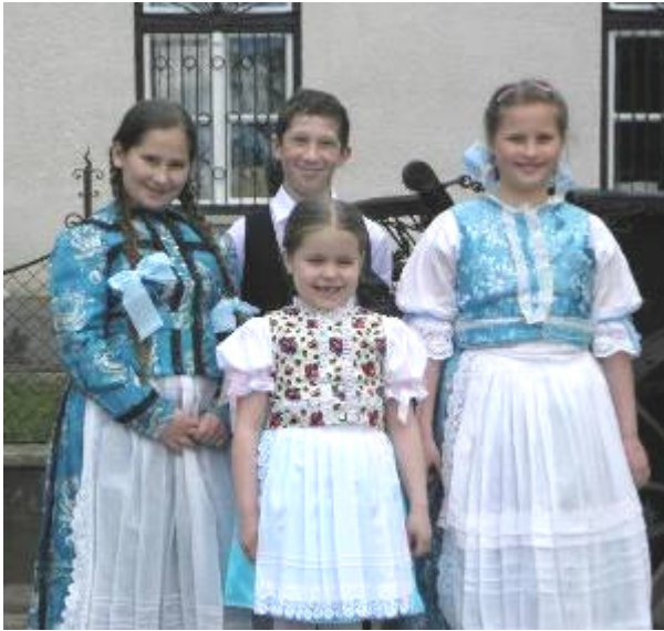
Tanító nénik Bajót